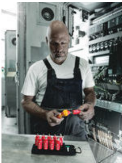
Die Wera Belts