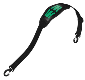
Wera 2go 6 05004355001 1 x 1470 x 38 mm