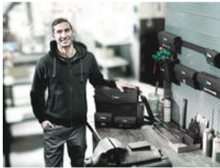
Wera 2go 2 – Der Dran- und Drinpacker