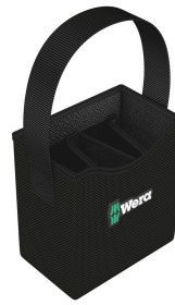
Wera 2go 4 05004353001 1 x 105 x 165 mm