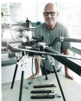
Die Wera Belts